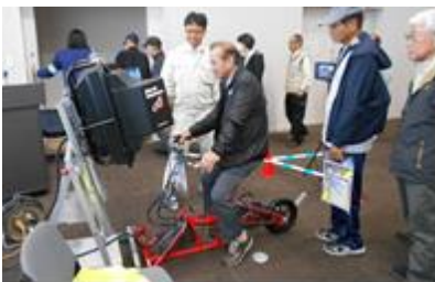
自転車シミュレーター

また、飲酒体験ゴーグルを着用して歩行してみましたが、ほとんどの方がまっすぐに歩けませんでした。適量を超えた飲酒によって、これほど感覚がマヒしてしまうのかと驚いています。