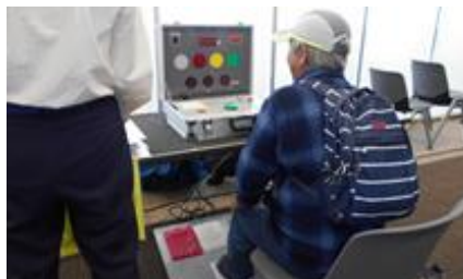
クイックステップ