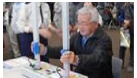
クイックキャッチ

就業先の都合等で、どうしても受講できなかった方は、次回は是非とも参加してください。